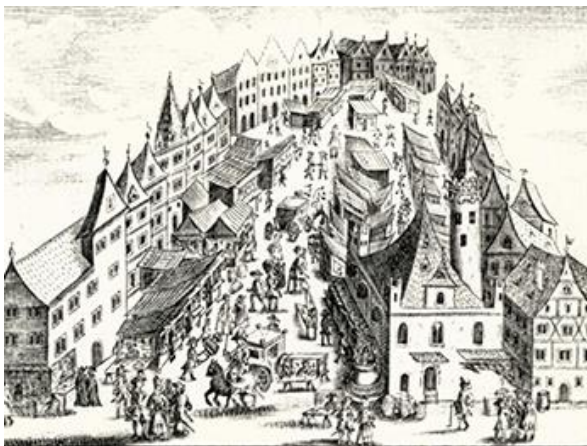
Die Frankfurter Messe auf dem Römerberg

Der Begriff „Börse“ entstand im 15. Jahrhundert: Im belgischen Brügge umschrieb er eine regelmäßige Versammlung reicher italienischer Händler auf dem Platz „ter buerse“, die auf dem Weg zu den Tuchmessen in den Niederlanden waren und dort regelmäßig Rast machten. Benannt war dieser Marktplatz nach dem dort ansässigen Patriziergeschlecht „van der Beurse“ (lat. „bursa“: Tasche, Geldbörse).